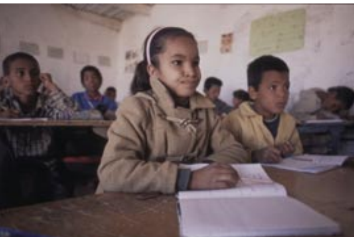
Pakolaisnuoret opivat nuorena lukemaan ja kirjoittamaan. Pojat ja tytöt käyvät samaa koulua.

Heidän yhteistyöjärjestöllä NUSW:lla (National Union of Saharawi Women) on keskeinen rooli leirien julkisten palvelujen, etenkin koulutuksen, järjestämisessä. Järjestö tekee yhteistyötä myös kansainvälisten naisjärjestöjen kanssa.