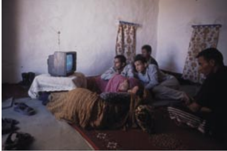
Hadaran perhe katsoo ajankulukseen meksikolaista saippuaoopperaa.

Wilayat jakautuvat puolestaan useaan dairaani eli kylään. Jokaisessa dairassa on oma pakolaisvaltuusto, joka pyrkii pitämään yllä julkisia palveluja eli lastentarhaa, koulua sekä sairastupaa. Jokaisessa wilayassa on lisäksi erillinen hallintorakenne, sairaala ja paikallinen radioasema.