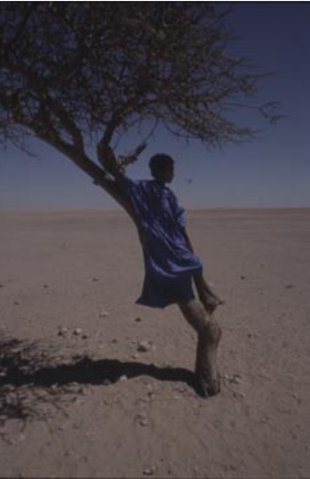
Pakolaisleirejä ympäröi autiomaata, jossa keski-kesän kuumuus lähen-telee 50 °C astetta.

Kesällä 2003 YK:n turvallisuusneuvosto ja Polisario hyväk-